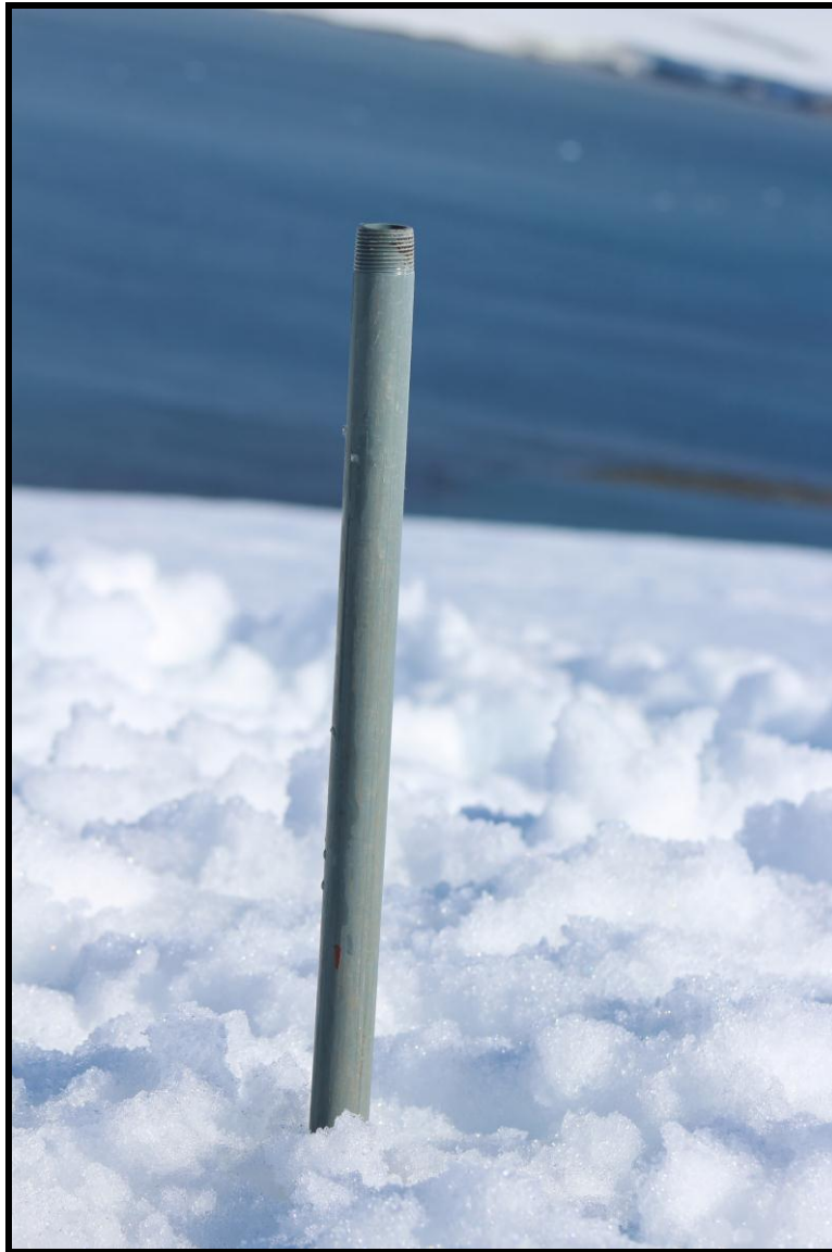
Figura 6.- Detalle de estaca D4

En las proximidades de cada estaca instalada se realizaron mediciones para conocer la densidad de la nieve acumulada en superficie, como se muestra en las figuras 7, 8 y 9.