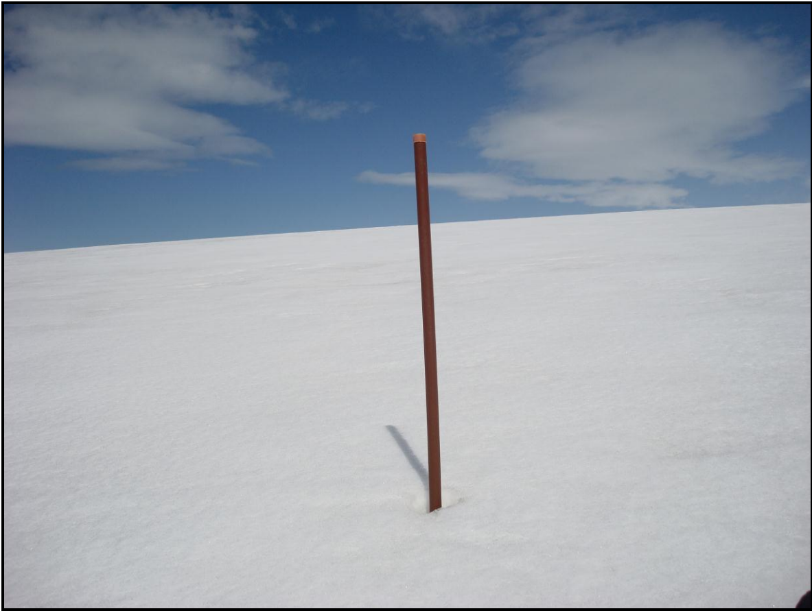
Figura 5.- Detalle de una estaca instalada C3