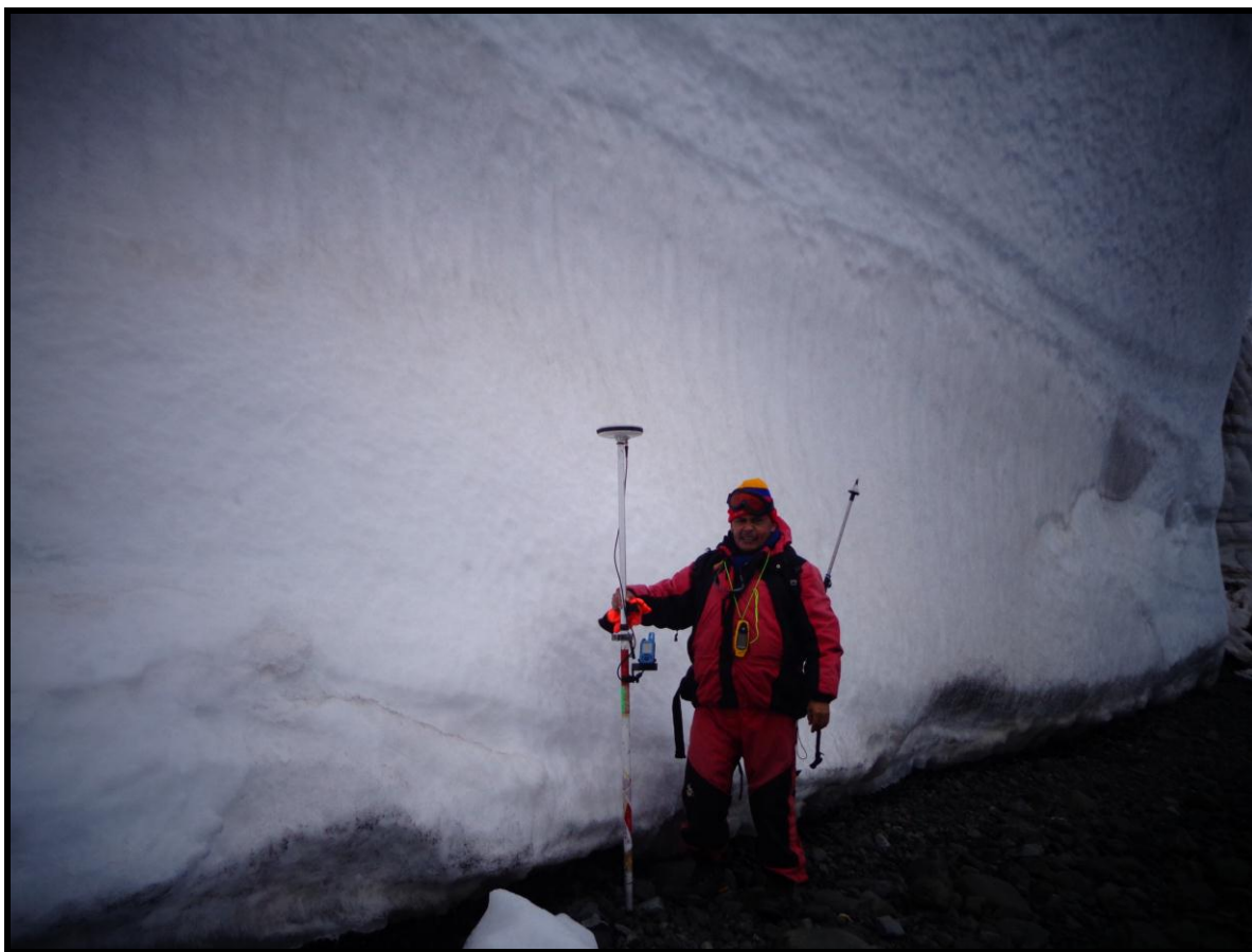
Figura 2.- Caminata en el frente del glaciar Quito (Sector Punta Riquelme), proceso de medición.

El trabajo de campo en su primera etapa se lo realizo para tener un contorno sobre la ubicación del frente del glaciar, este se lo realizo utilizando mediciones GPS mediante caminata desde la estación Pedro Vicente Maldonado en dirección S-W , la caminata desde Punta Ambato en dirección N-E no fue posible realizarla por la caída reciente de bloques .(Fig. 2)