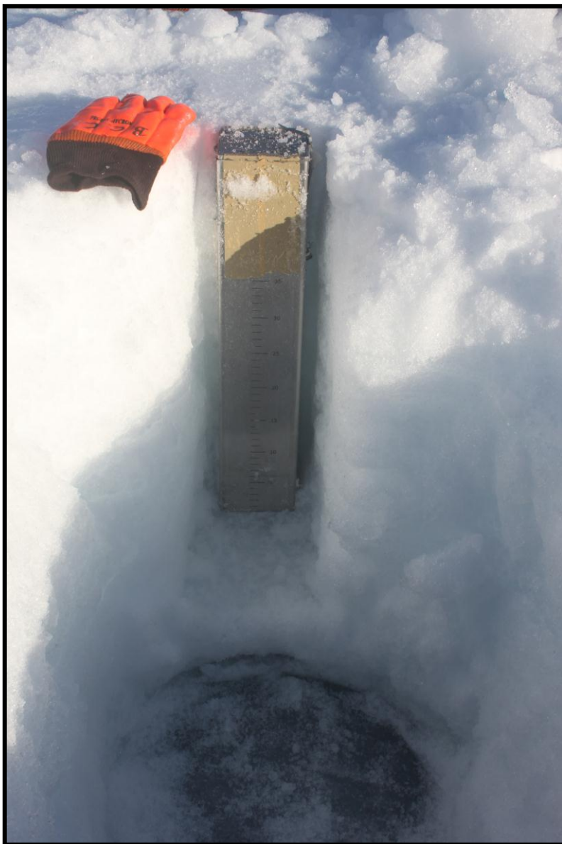
Figura 9.- Medición de la densidad de la capa de nieve en el sector B