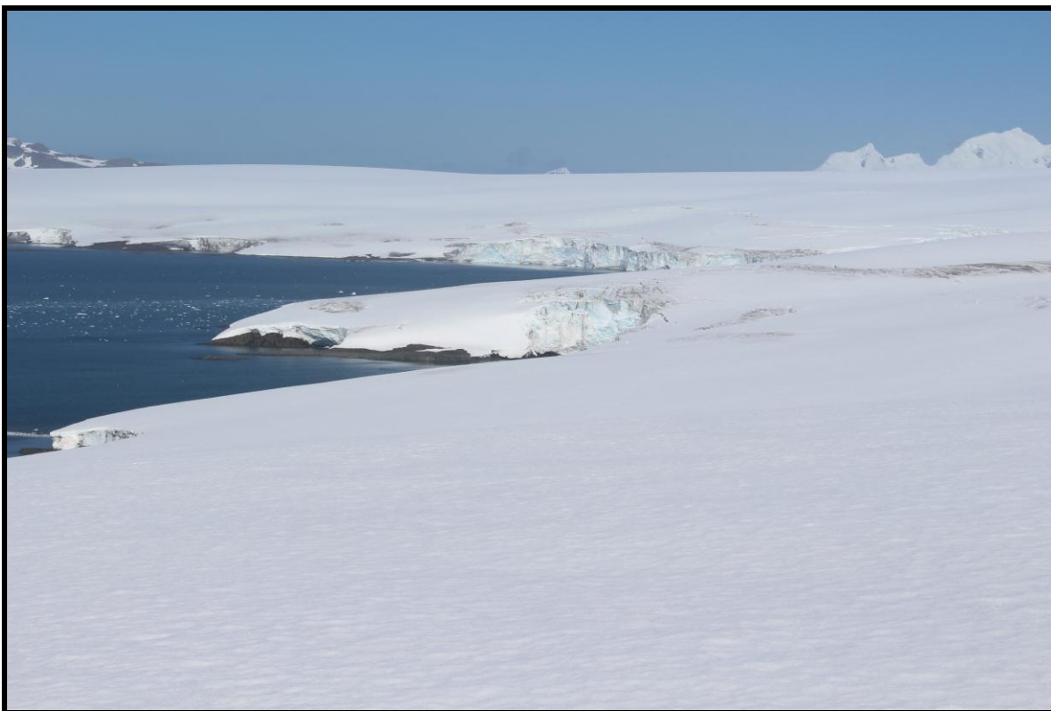
Figura 3.- Frente del glaciar Quito visto desde S-E.