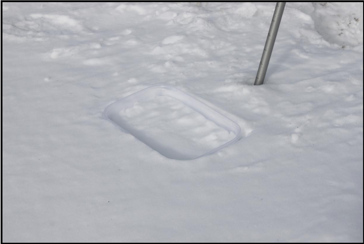
Figura 10.- Medición de sublimación durante el día (9 am)

Con la finalidad de complementar el estudio sobre balance de masa se realizaron medidas para estimar las tasas de fusión y sublimación que se producen en la nieve acumulada en los alrededores de la estación meteorológica instalada, para ello se realizaron medidas de sublimación empleando lisímetros los cuales son pesados tres veces durante el día para determinar la variación de densidad. Dicha experimentación se la realizó durante todos los días que se permaneció en la estación y cuando las condiciones meteorológicas lo permitían como se puede ver sobre las figuras 10, 11 y 12