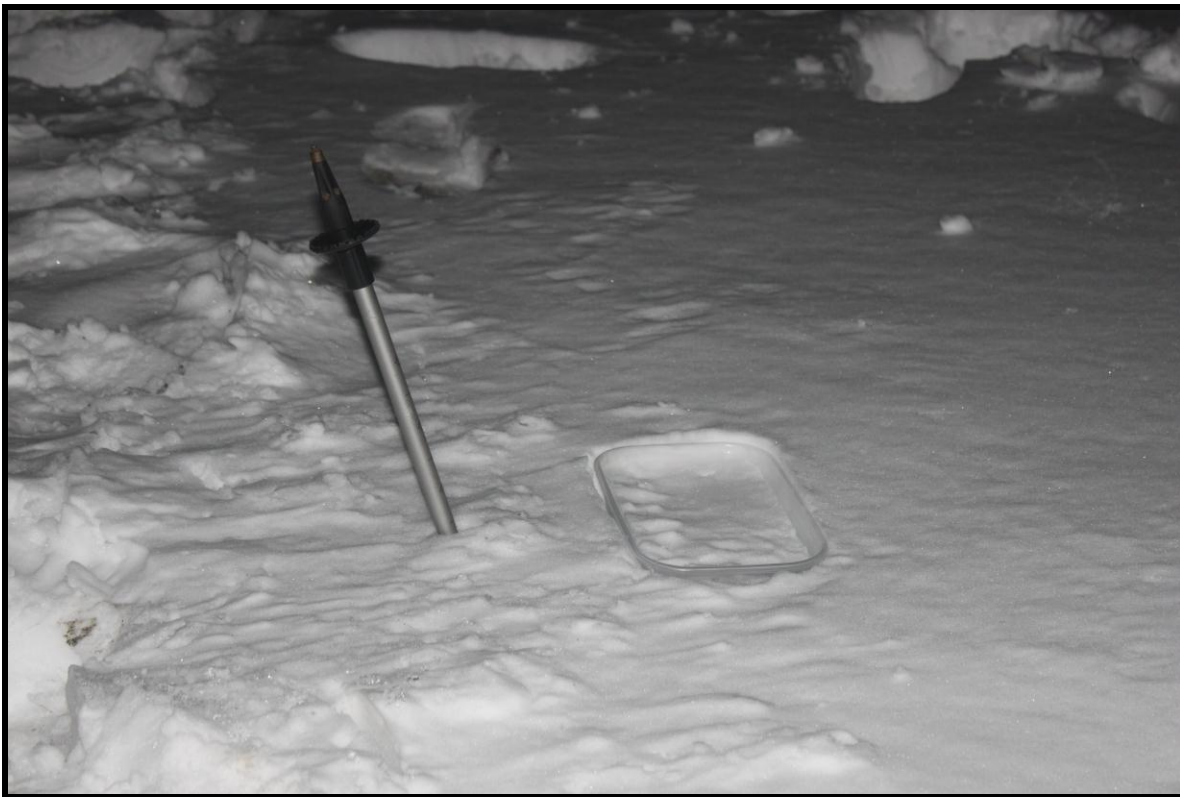
Figura 11.- Medición de sublimación durante la noche (22 horas)