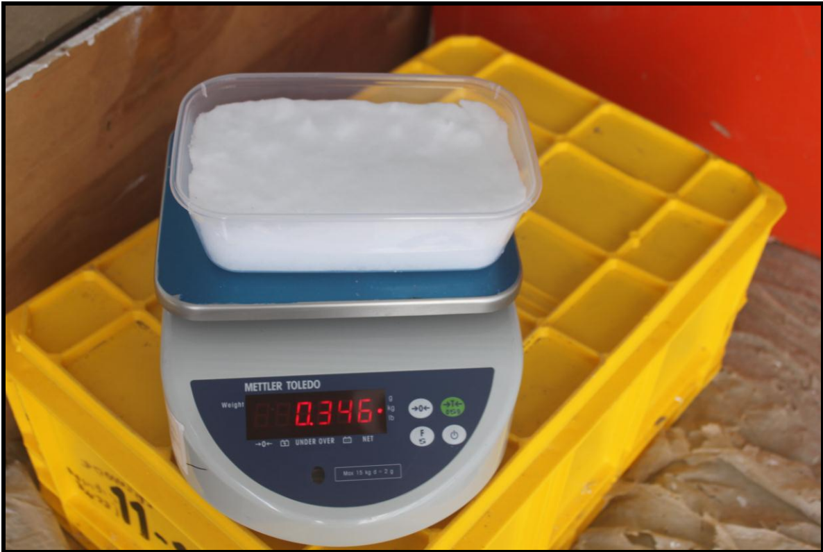
Figura12.-Proceso de pesada d los lisímetros en el área de trabajo