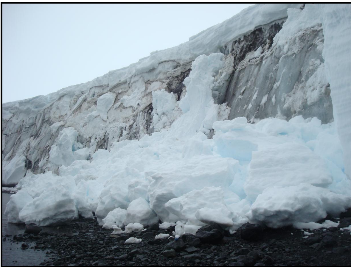
Figura 4.- Frente desde el glaciar Quito visto desde el NE.

La red instalada en los años precedentes (2010- 2011) presenta un funcionamiento óptimo. (Fig. 5-6).