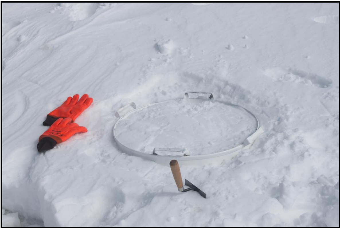
Figura 13.- Medidas de fusión cada 24 horas

Finalmente se realizaron medidas para estimar la fusión que se produce en la superficie de nieve durante 24 horas, para lo que se utilizó una tina de fusión construida para el efecto.