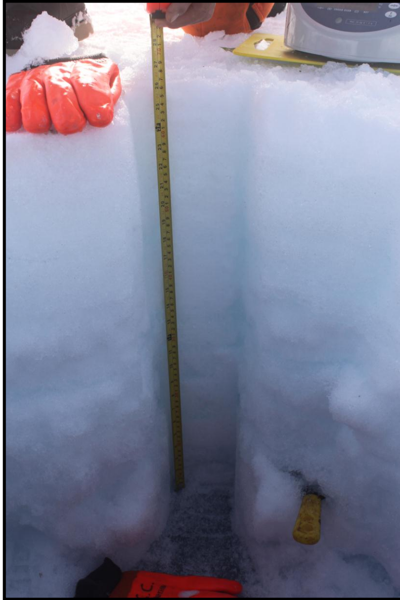
Figura 8.-Medición del espesor de la capa de nieve