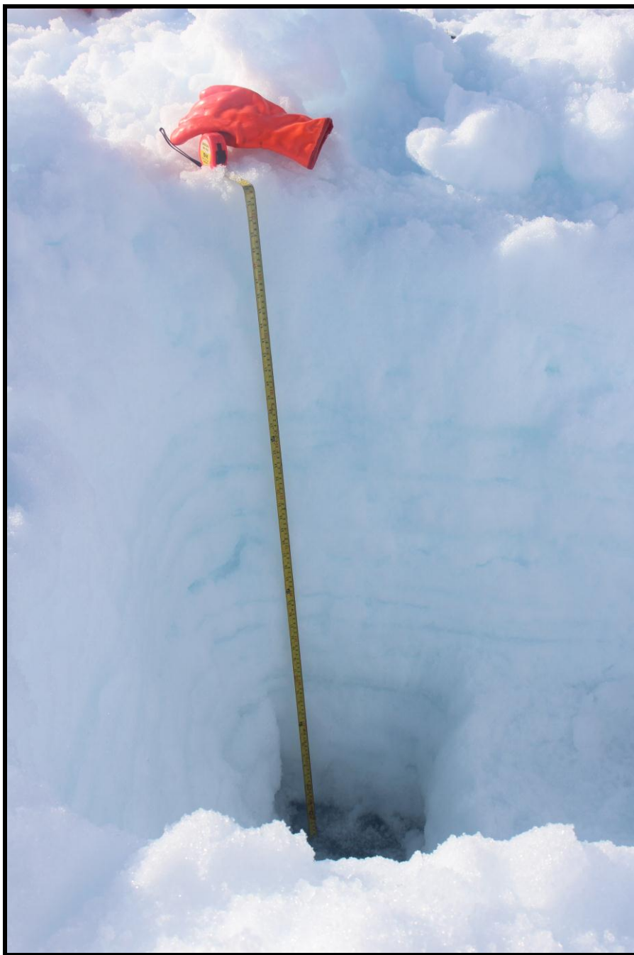
Figura 7.- Superficie de ablación 2014