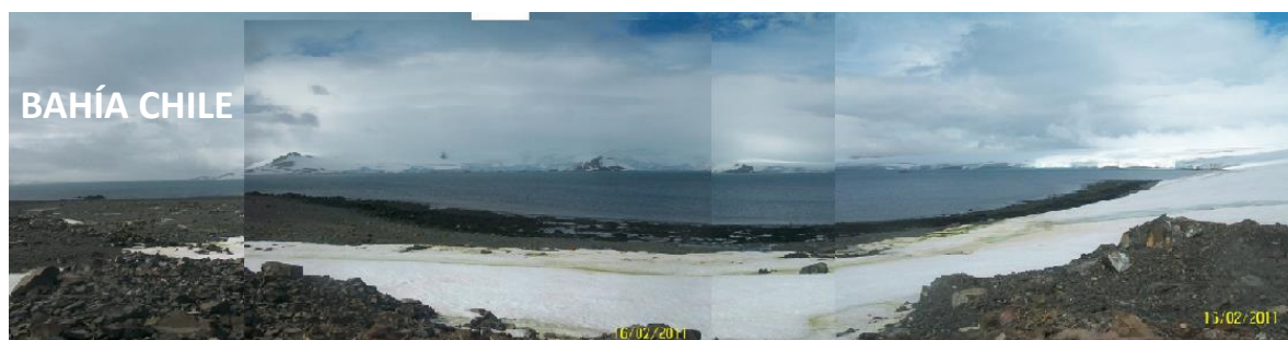
Tabla # 1 Coordenadas de las estaciones muestreadas en agua de mar.